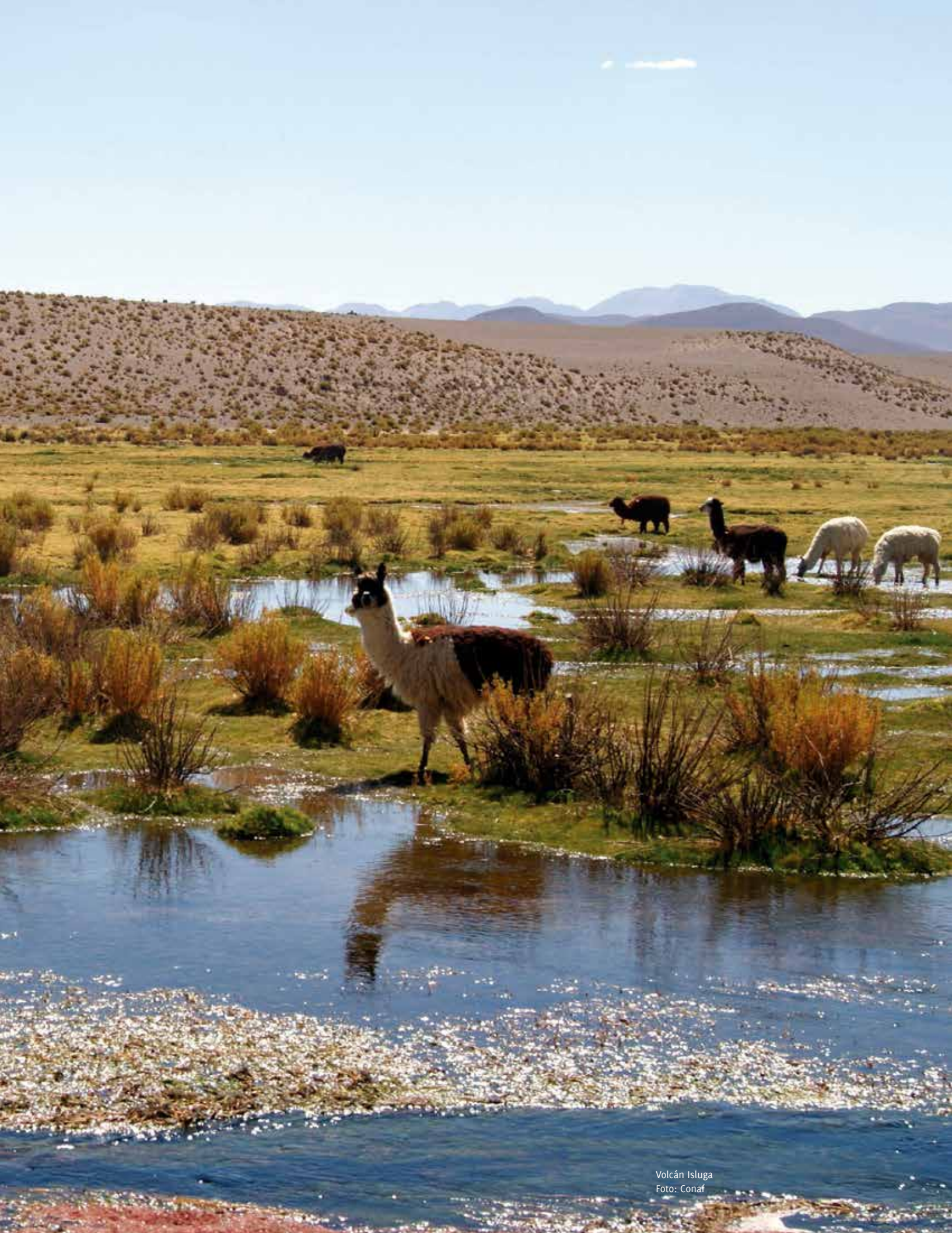
Volcán Isluga